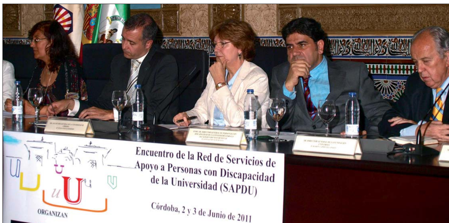
Encuentro de la Red SAPDU, Córdoba, 2011.

el compromiso de los poderes públicos no habría sido tan decidido. Por ello cabe citar también a los propios interesados como auténticos impulsores de compromisos de la administración y acciones concretas. También en las universidades han sido los propios estudiantes los que, con su presencia, han provocado los cambios más importantes. Veamos a continuación algunos de ellos.