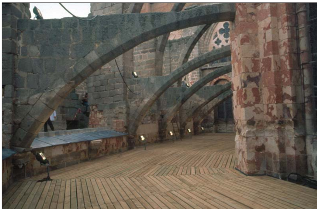
El ábside de la catedral de Ávila, convertido en espacio transitable por el arquitecto Pedro Feduchi. Este recinto puede incorporarse al itinerario del adarve. Inaccesible