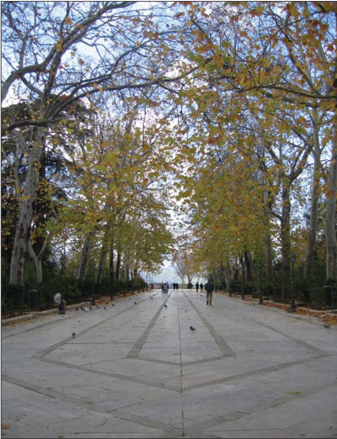
Alameda del Tajo (Ronda)