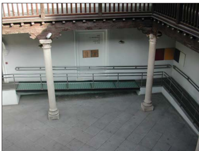
Patio interior de la Posada del Rosario (Albacete)