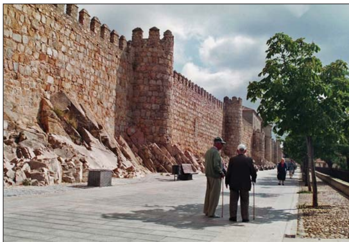
Ávila. Paseo en torno a las murallas

María Zambrano plasmó con maestría el equilibrio y su levedad, y es ese equilibrio otra de las herramientas indispensables para acertar al plantear soluciones que faciliten la accesibilidad del Patrimonio. Pero el equilibrio, por su propia naturaleza, es inestable, de ahí que insista de nuevo en la necesidad de trabajar con discreción y con sentido común en este tema, de modo que no se altere la esencia del pasado ni se cierren las puertas al derecho de conocerlo y disfrutarlo por cada persona.