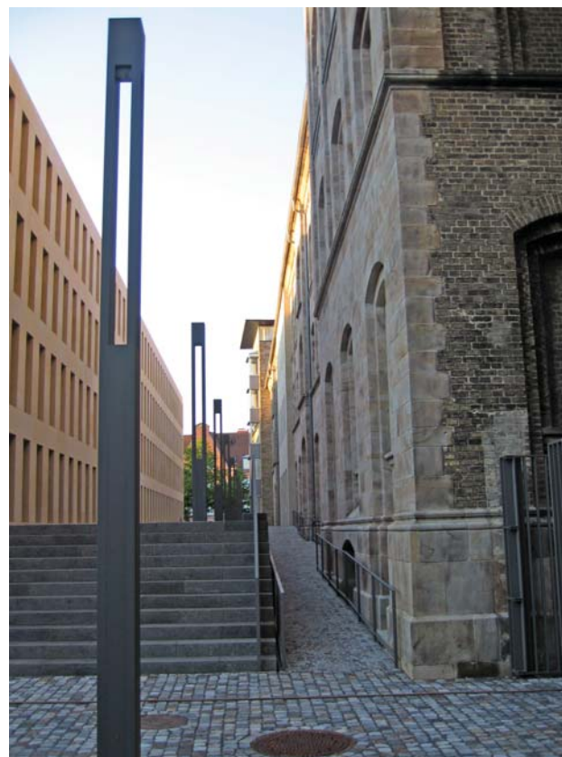
Rampa sobria y discreta. Entorno histórico monumental de Münster (Alemania)