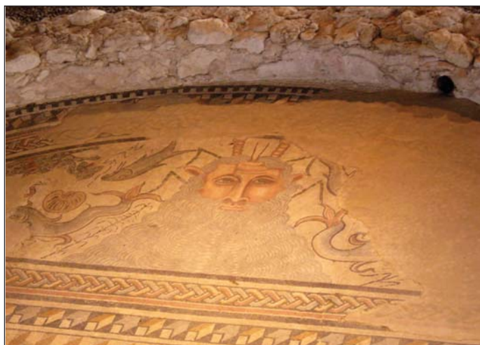
Detalle mosaico, Carranque