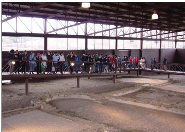
Yacimiento Arqueológico de Carranque, Toledo