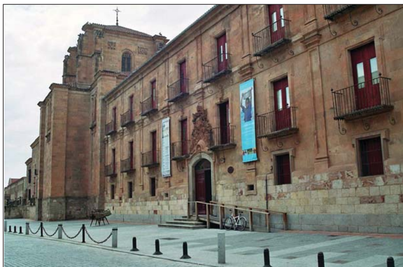
Salamanca, sobria rampa en madera