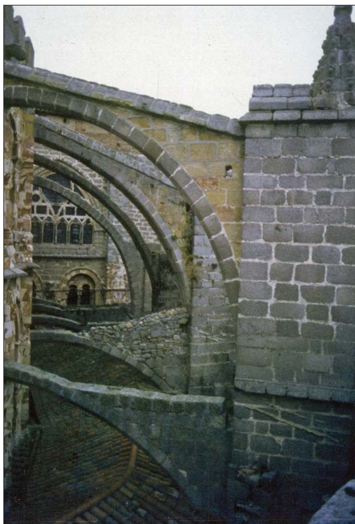
Espacio bajo los arbotantes del ábside de la catedral de Ávila, antes de su restauración

cada cual desde su óptica pero con un mismo propósito, esto es, aquel de mejorar la accesibilidad sin mermar el patrimonio.