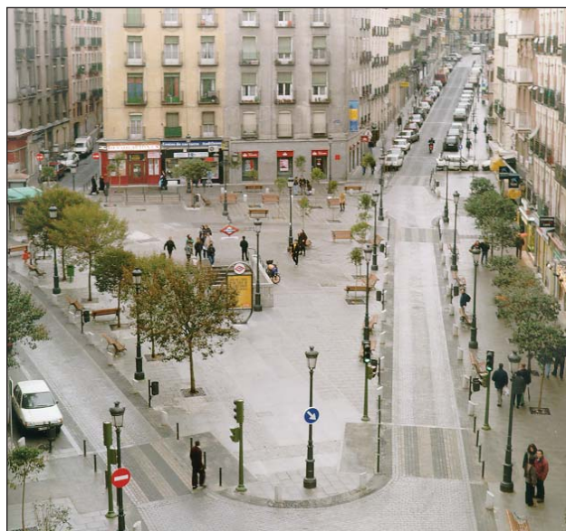
Plaza de Lavapiés, Madrid

este análisis del binomio Accesibilidad y Patrimonio requiere asomarnos a ambos conceptos, a ambas realidades, a su esencia y raíces, a su evolución, a sus múltiples manifestaciones y enfoques.