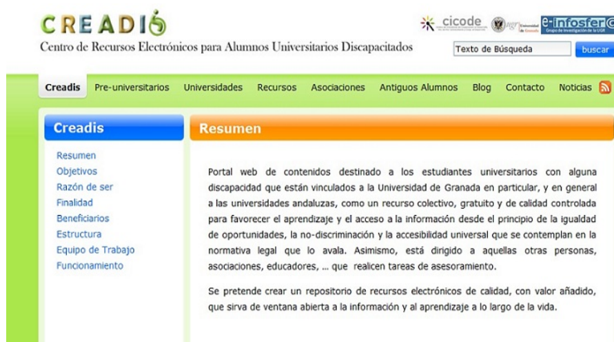
Figura 2. Distribución de los contenidos del portal CREADIS.

académico, el aprendizaje para toda la vida (Figura 2). La metodología para la búsqueda, selección y posterior incorporación de los contenidos atendió a los criterios y objetivos del portal.