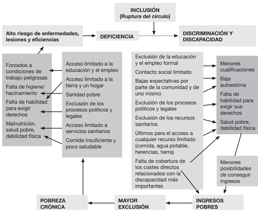
Figura 2. Ciclo de la pobreza/discapacidad