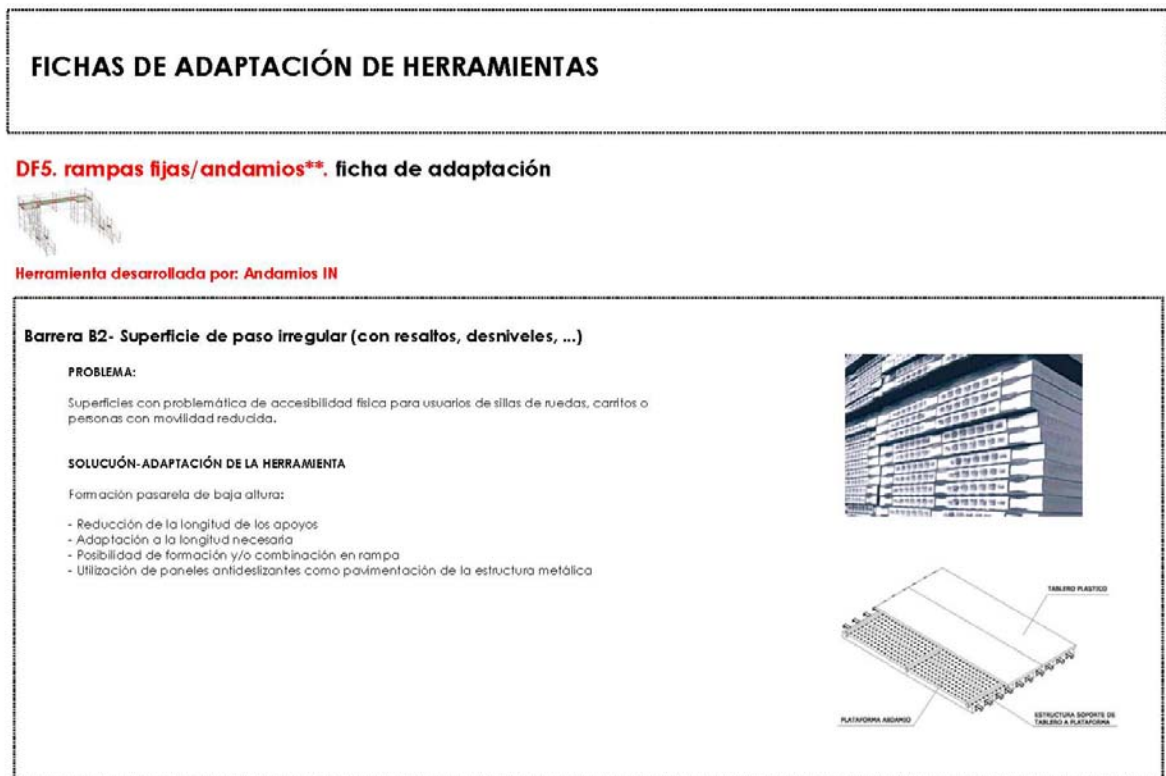
Figura 4. Ejemplo de ficha de adaptación de dispositivo. Rampas fijas / andamios