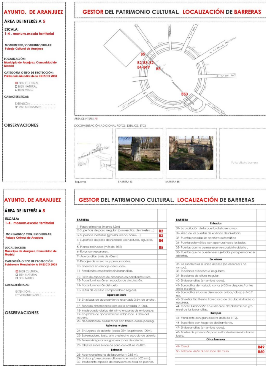
Figura 2. Ejemplo de ficha de localización de barreras. Gestor