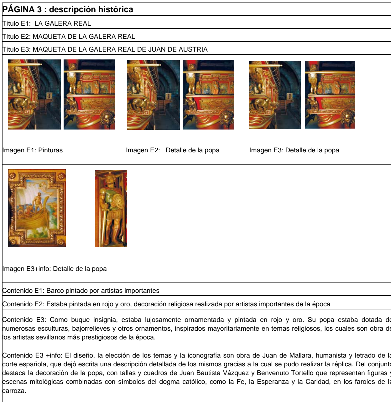
Figura 5. Ejemplo de niveles de información previstos

De esta forma, las ayudas a la accesibilidad se plantean en el proyecto como elementos que refuerzan la relación entre el individuo y el patrimonio, pero que en ningún caso la sustituyen. Al constatarse la existencia de una mediación inevitable entre el ciudadano y el patrimonio, en definitiva entre el hombre y la experiencia de la realidad, la labor se centra en la obtención y transmisión de una información de calidad y adaptada, así como en su actualización y verificación.