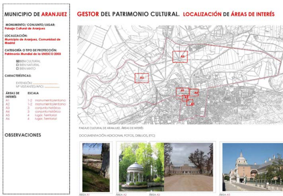
Figura 1. Ejemplo de ficha de localización de áreas de estudio

La primera fase de la metodología consiste en la elaboración de tablas que permitan a los gestores definir el estado de accesibilidad física del patrimonio del que se ocupan. La detección de las barreras supone en primer lugar su localización y luego su reconocimiento. Si la localización supone siempre un trabajo de campo con instrumentos de diversa naturaleza, el reconocimiento del tipo de barreras puede ser agilizado dotando a los gestores de un listado de barreras existentes, que se ha elaborado sobre la base de los resultados del subproyecto 1 de PATRAC. Este proceso puede ser directo y sencillo, al estar regulado por tablas técnicas que el gestor podrá completar con la ayuda de técnicos expertos en patrimonio. Las tablas que se proponen están adaptadas a todas las escalas del patrimonio, permitiendo una distinción, en el caso de lugares y conjuntos, entre las diferentes áreas de interés que los articulan (Figuras 1 y 2). Una vez señaladas en las planimetrías las barreras e identificado el tipo en el listado que se proporciona, el gestor puede aportar la documentación que estime oportuna para una mejor identificación y posterior solución de los problemas detectados.