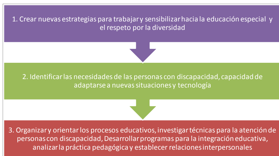
Figura N 1 Habilidades desarrolladas por los egresados de la CEEI según nivel de importancia que ellos les conceden