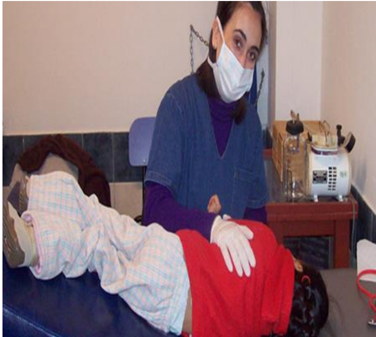
Figura 3 Terapia respiratoria a niños y niñas