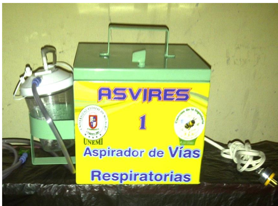
Figura 4 Prototipo 1.0 Aspirador de flema e insumos