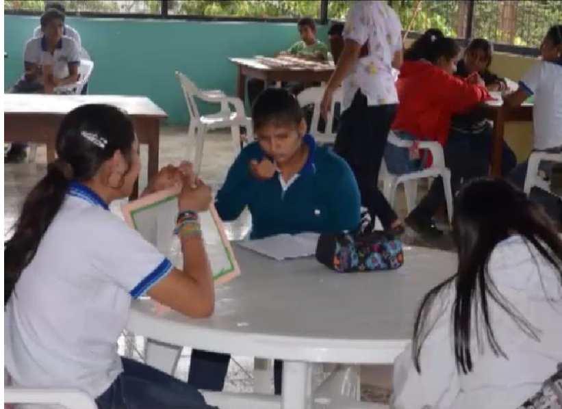
Figura 2 Niños y niñas en el Centro de Educación Especial AVINNFA