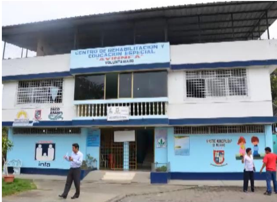
Figura 1 Centro de Educación Especial AVINNFA