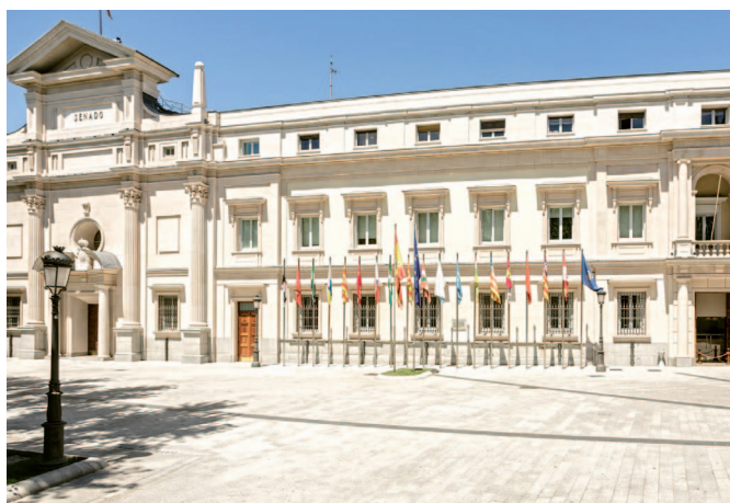
Este es el edificio del Senado en Madrid.

Las Cortes Generales están formadas por el Congreso de los Diputados y el Senado.