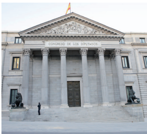
Este es el edificio del Congreso de los Diputados en Madrid.