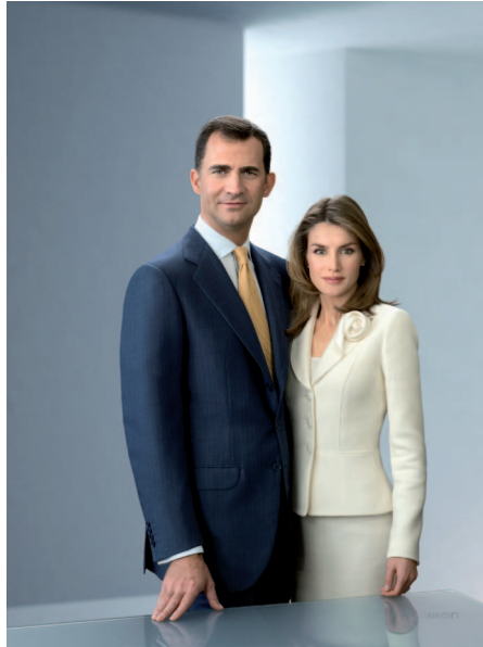
Los Reyes de España son Felipe Sexto y Letizia.