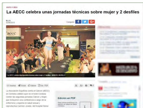
Figura 4: Noticia del evento publicada en el Diario Córdoba 21/6/2016. / www.diariocordoba.es .

Tras el evento (Post-Evento) se publicaron noticias en diarios locales y se difundieron fotografías y agradecimientos en redes sociales. Para la prensa hubiera sido recomendable difundir una nota informativa en la que se dieran los datos de los ponentes y los objetivos de la jornada para, de esa manera, unificar la información a los ciudadanos.