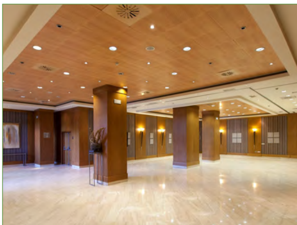
Figura 2. Parte de la sala polivalente del Hotel Córdoba Center de Córdoba.

Las zonas del hotel destinadas al evento, como se ha indicado con anterioridad, se situaban en la planta sótano y en la azotea. La comunicación vertical por el edificio está resuelta mediante ascensores y escalera, ambos elementos ajustados a la normativa vigente.