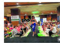
Una de las participantes en el desfile, ayer en el hotel Córdoba Center.

El Hospital Reina Sofía detecta alrededor de 400 casos de cáncer de mama cada año, con un más que elevado índice de sanación. No en vano, la supervivencia por este tumor se incrementa cada ejercicio un 1,4%. Se trata de una enfermedad que cada día afecta a más mujeres que reciben el apoyo y la ayuda de la familia durante todo el proceso y también de la Asociación Española Contra el Cáncer (AECC), entidad que ofrece cuanta información precisa, además de servicios complementarios, y de todo el cariño que requieren. La organización también ofrece encuentros formativos a sus asociados, como la segunda jornada Mujer con cáncer, entre ellas , que se celebró ayer y que sirvió para intercambiar experiencias y conocer cómo afrontar la sexualidad durante la enfermedad.