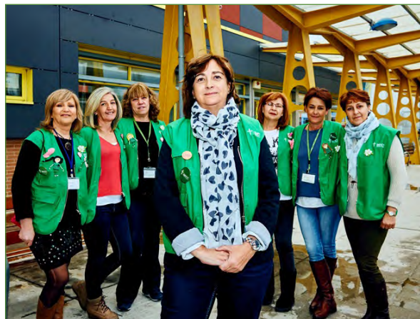
Figura 3. Identificación de la organización. Integrantes de la AECC del municipio de Rivas-Vaciamadrid (marzo 2016).

El personal de la organización estaba identificado mediante acreditación y vestidos con chaleco verde de la AECC, lo que los hacía fácilmente visibles.