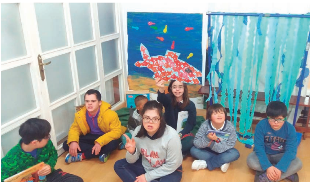
Actividad del recurso LEE. Cuento de Nadarín

Lo cierto es que los profesionales que hemos participado en este recurso estamos gratamente sorprendidos con la respuesta de los jóvenes. Su actitud en todas las sesiones ha sido impecable. Han aprendido las piezas y las coreografías, demostrando entusiasmo y profesionalidad. Incluso alguno que habitualmente no quiere actuar en público, lo está haciendo y además disfrutando como nunca. Esperamos seguir aplicando este recurso en años sucesivos con tanto éxito como en esta ocasión.