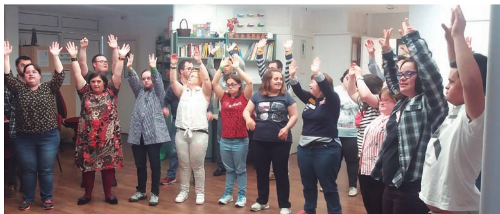
Dinámica del Coro de las Emociones