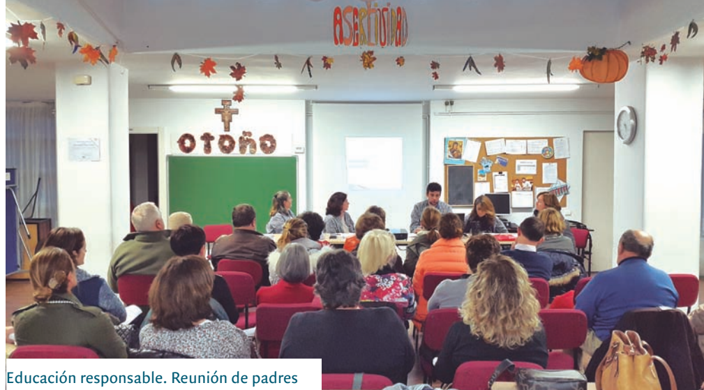
Educación responsable. Reunión de padres