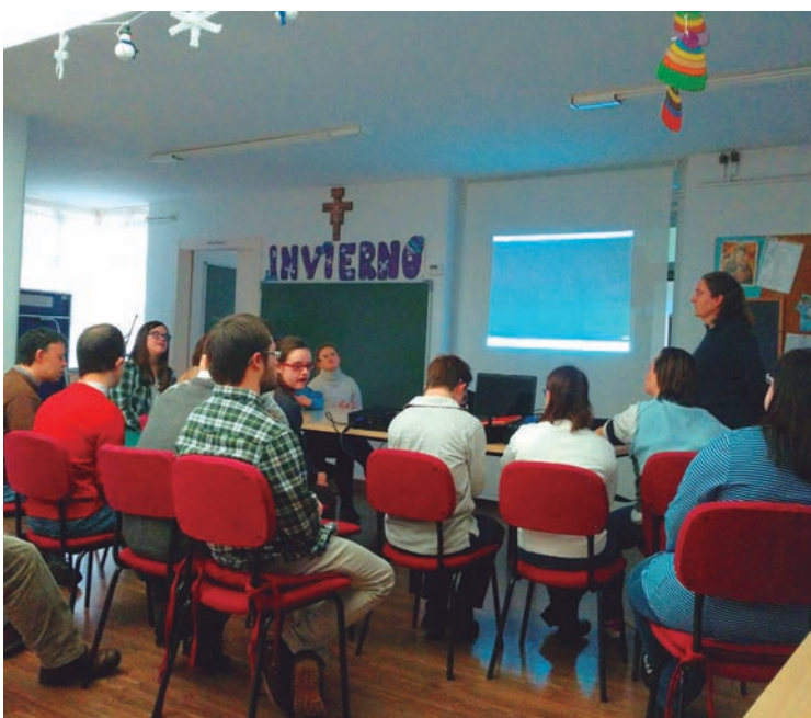
Vídeo de literatura, emociones y creatividad”

Lectura y emociones mantiene los fundamentos de Literatura, Emociones y Creatividad, pero en este caso dirigidos a la etapa pre-lectora, por lo que no es imprescindible el dominio de la lectura.