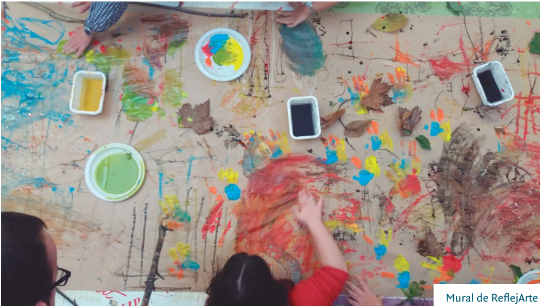
Mural de ReflejArte

la Fundación Botín y la Consejería de Educación. El centro ocupacional de la Fundación Síndrome de Down de Cantabria pasaría a ser el primer centro acreditado de estas características (adultos con discapacidad).