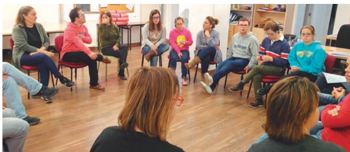
Dinámica grupal de banco de herramientas