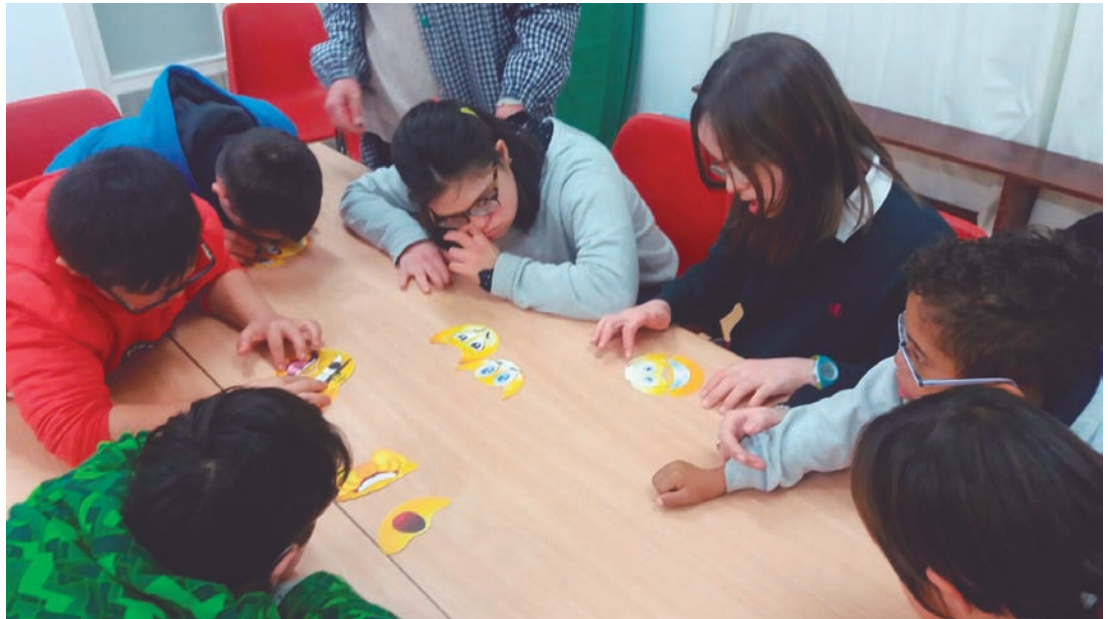
Actividad de LEE

El recurso cuenta con un personaje, El Mago de la Palabra , que hace la función de mediador, el cual es el encargado de acercar la lectura a los alumnos. La figura de El Mago de la Palabra es fundamental en el desarrollo del recurso a lo largo de sus tres años de duración.