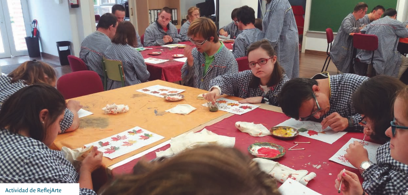
Actividad de ReflejArte