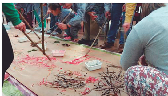
Mural para ReflejArte

La expresión emocional es la habilidad en la que hemos detectado más necesidades. Hay que decir que muestran capacidad de interpretar las emociones de los demás y las propias de una manera general; es decir, saben si lo que sienten es bueno o malo, pero necesitan apoyo para poner palabras a lo que sucede en su interior. La experiencia refleja que ellos tienen más facilidad para cubrir las necesidades emocionales de los demás que para expresar sus propios sentimientos. El proceso