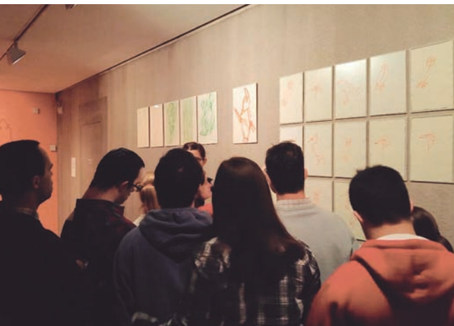
Salida a la exposición de Joan Jonas en la Fundación Marcelino Botín (ReflejArte)

El Coro de las Emociones se centra en el canto coral, entendido como una actividad atractiva, asequible y enriquecedora para todos, con independencia de las dotes vocales o musicales de cada cual.