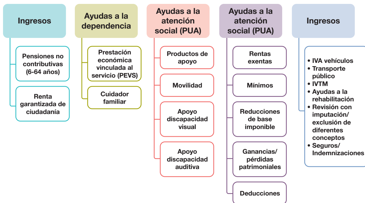
Figura 2. Categorías de ingresos