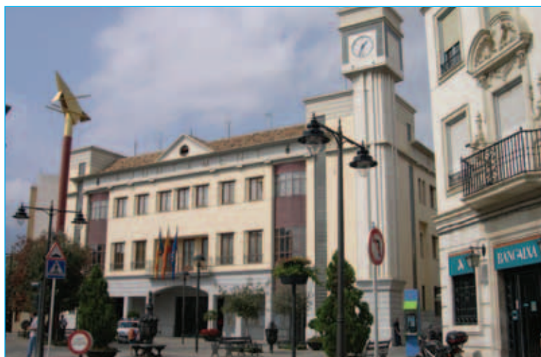
■ El propio edificio consistorial incluye las más altas normas de accesibilidad.