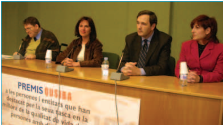
■ Edición anual de los Premios QUSIBA