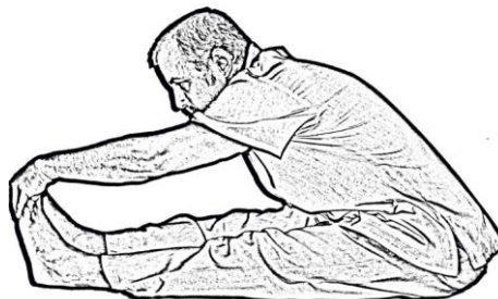
Figura 9. No doblar demasiado la espalda ni elevar las rodillas

Hay que estirar las piernas y colocarlas juntas ayudándose de las manos que mantienen la postura de sentados al apoyarse en el suelo con los dedos mirando hacia los pies, calentar las manos si se precisa, bajando desde la cadera procurando no doblar demasiado la espalda ni elevar las rodillas y por último masajear los pies ( figura 9 ).