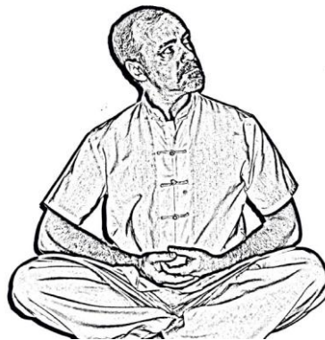
Figura 3. Tronco erguido

Cada uno de los movimientos se ha de realizar con doce repeticiones a cada lado, un total de veinticuatro. El tronco en todo momento ha de estar erguido ( figura 3 ).