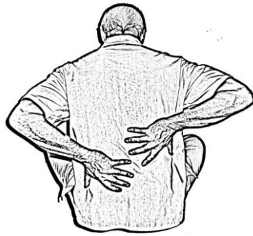
Figura 7. Palmas de la mano en la región lumbar

Tras estos movimientos se termina estirando las piernas y dejándolas relajadas con los dedos de los pies apuntando hacia arriba, la espalda recta y los hombros relajados. Zhengcai [31] propone, una vez estiradas las piernas, mover los brazos de una forma diferente, ligeramente flexionados se hacen círculos con un hombro primero y con el otro después, contando 36 vueltas con cada uno. Prouzet [33] señala que el giro de los brazos es con ellos estirados, los dos a la vez van de atrás hacia adelante en la vertical y viceversa en ambos casos 36 veces.