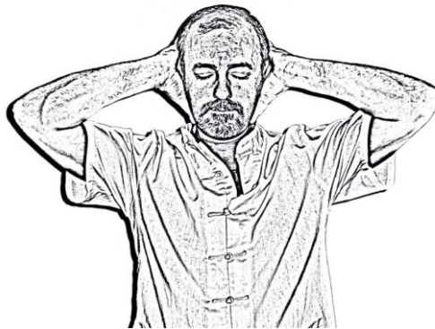
Figura 2. Palmas de las manos, dedos entrelazados y codos abiertos

Posteriormente hay que llevar las palmas de las manos con los dedos entrelazados y los codos abiertos hasta cubrir las orejas respirando suavemente durante 9 ciclos respiratorios ( figura 2 ).