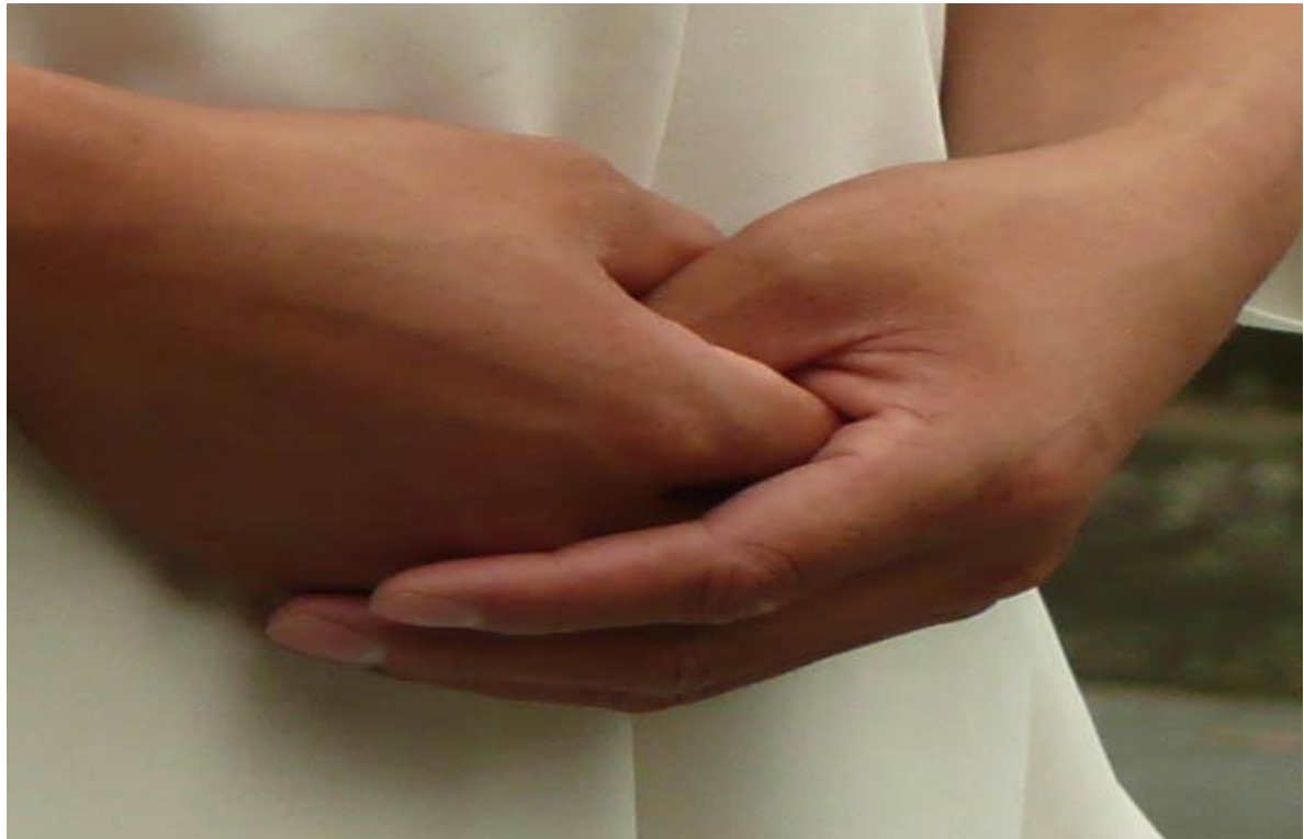
Figura 1. Posición de las manos

En esta posición, es preciso cerrar los ojos e intentar vaciar la mente de cualquier pensamiento que la distraiga ya que mantener los ojos así favorece que la atención no se disperse y se mantiene quieto el Shén (espíritu). Según Aparicio [28] el cuerpo es una manifestación más burda de la energía (moléculas, materia), y el Shén (así denominan al conjunto de todas las actividades mentales) una manifestación más depurada y sutil de la energía básica. Se debe fijar la atención al principio en la respiración y enfocar la mente en la temperatura que tiene el aire al entrar en los pulmones, sintiéndolo en la nariz frío y cargado de oxígeno y notarlo salir caliente y viciado, con poca energía útil para el cuerpo. La mente ha de estar tranquila, vacía.