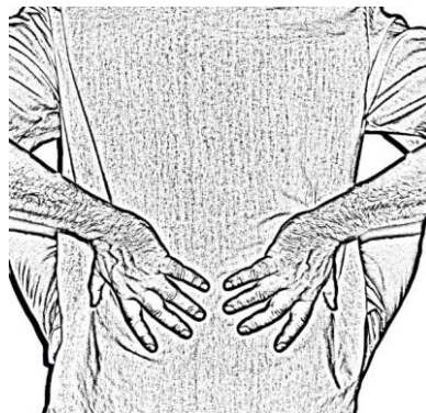
Figura 5. Masaje en la región lumbar - Cuarto Duan

Partiendo desde la posición de sentado con la espalda bien recta pero relajada, nos frotamos las manos hasta calentarlas considerablemente y damos un masaje a la región lumbar durante unas treinta y seis vueltas ( figura 5 ). Hacemos un círculo hacia adentro bajando por el interior de la columna y subiendo por la parte externa [33]. De esta forma favorecemos la circulación sanguínea de la zona y su elasticidad. Se hace descender el fuego del corazón hasta los riñones donde reside la energía (se provoca una hiperemia lumbar bilateral).