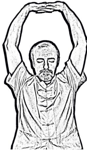
Figura 8. Estiramiento de brazos con las piernas estiradas

Tras este movimiento, Serrato [27] y Zhengcai [31] plantean que se inicie la exhalación, se suelten los dedos y se bajen las manos rotándolas para colocarlas sobre la cabeza una sobre la otra, la derecha por fuera los hombres y la izquierda por fuera las mujeres, se dan tres golpes suaves con las manos y se realizan varias respiraciones completas.