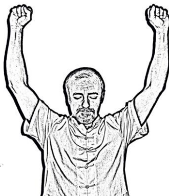
Figura 4. Elevación de los brazos con puños cerrados

Se parte de la posición de sentado, con la espalda y los hombros relajados. Elevamos los brazos con los puños cerrados por encima de la cabeza como para agarrar una barra sobre ella ( figura 4 ).