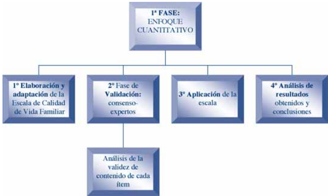
Tabla 1. Proceso de reformulación de ítems para la sección I de la Escala de Calidad de Vida Familiar