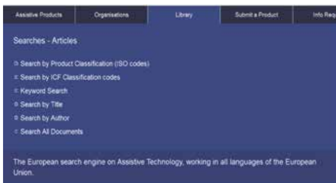
Imagen 6. Página correspondiente a búsqueda por Biblioteca (en este caso, por el recurso "Artículos").

título del artículo en inglés y su idioma original, los autores, el año de publicación, la base de datos de la cual procede el artículo, los códigos de la clasificación ISO y de la clasificación CIF correspondientes al tema