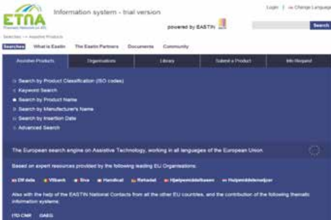
Imagen 1. Página de inicio del prototipo ETNA.