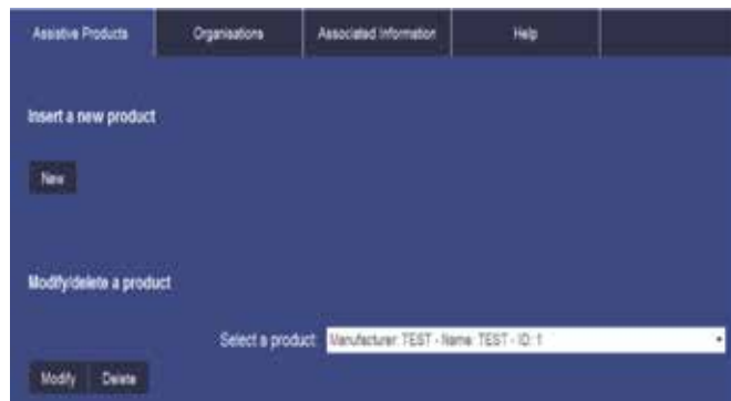
Imagen 7. Pantalla de la página para la inclusión de contenidos.