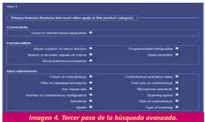
Imagen 4. Tercer paso de la búsqueda avanzada.