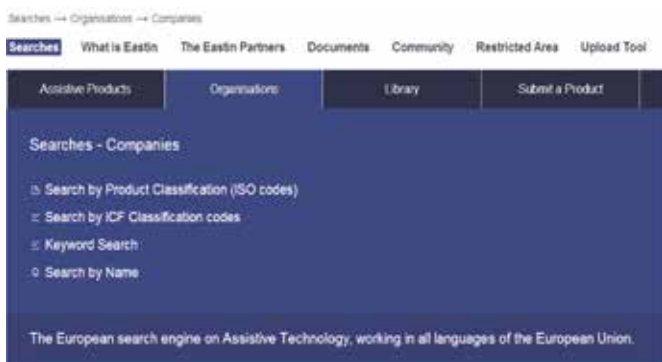
Imagen 5. Pantalla correspondiente a búsqueda para el recurso "Empresa".