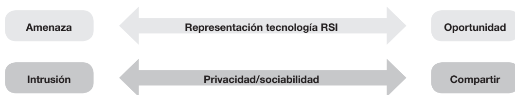
Figura 1. Ejes valorativos en la percepción y actitudes ante las redes sociales virtuales

Al combinar ambos ejes valorativos, se observa la articulación de los diferentes discursos, esto es, de las diferentes imágenes y actitudes ante las redes sociales en Internet que sostienen distintos segmentos sociales. La Figura 2 recoge, a título de síntesis, estas posiciones.