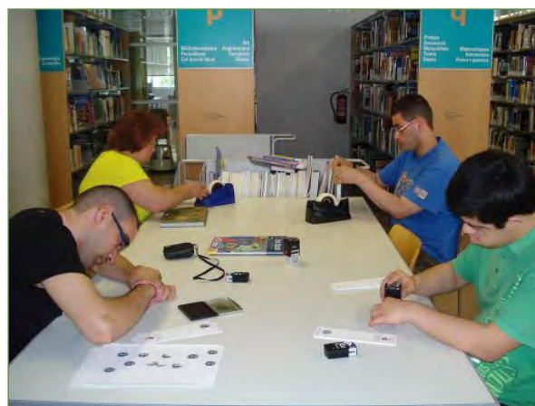
Preparando los puntos de libro, forrando y poniendo logotipos de la biblioteca en los documentos