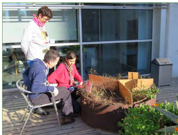
Asistentes al programa Jardineros de la Biblioteca Bellvitge.