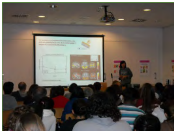
Conferencia de la neurobióloga Mara Dierssen Entorno y cerebro en las personas con discapacidad intelectual.