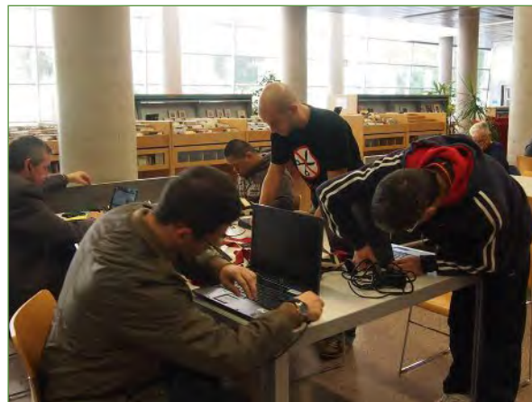
Revisando los ordenadores portátiles de la biblioteca para su préstamo