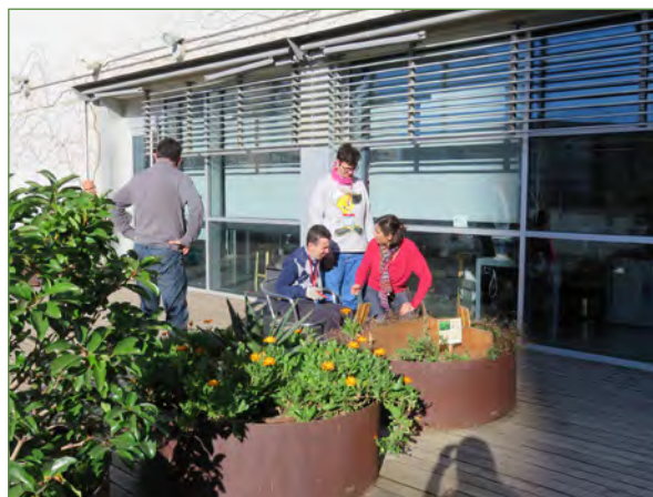
Asistentes al programa Jardineros de la Biblioteca Bellvitge.