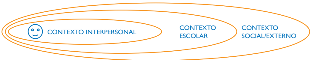
Gráfico: Modelo ecológico para la comprensión de la violencia escolar.

Para comprender el acoso escolar y concretamente el acoso escolar en niñas y niños con discapacidad es necesario realizar un análisis exhaustivo del contexto individual, escolar, económico y cultural en el que se genera.