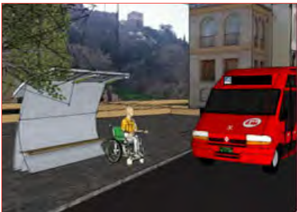
imagen adjunta. También, e identificado en la misma imagen, incluir información en braille para que personas con deficiencia visual puedan identificar la parada y los buses que pertenecen a dicha parada.