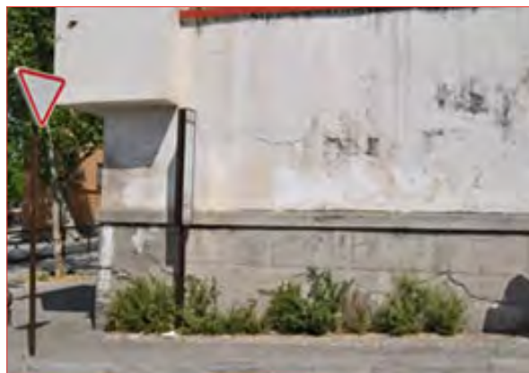
imagen adjunta. También, e identificado en la misma imagen, incluir información en braille para que personas con deficiencia visual puedan identificar la parada y los buses que pertenecen a dicha parada. Se propone la reubicación de la parada.

En esta fase se propone la inclusión del símbolo internacional de accesibilidad (SIA) avisando de qué paradas son accesibles, tal como se puede ver en la