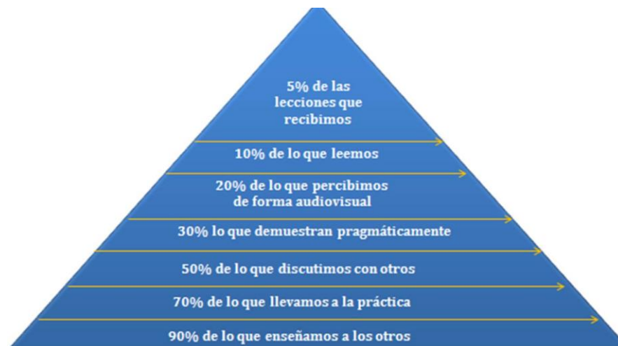
Figura 3: Pirámide del Aprendizaje. Fuente: Fernández (2014).

Siguiendo estas ideas, Robinson (2015), explica cómo funcionan los programas de educación alternativa en los EE.UU., el autor identifica que