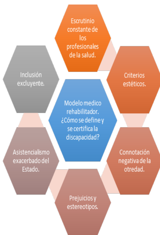
Figura 2 ¿Quiénes y que elementos constituyen los imaginarios?

discapacidad, influye notablemente en la forma en que el Estado aborda la discapacidad. El Estado interviene desde una óptica aun asistencialista y subsidiaria, evitando profundizar en la identificación y supresión de aquellos mecanismos que constituyen las exclusiones y desigualdades de la que son víctimas las personas con discapacidad (Rosato, Angelino, et.al 2009).