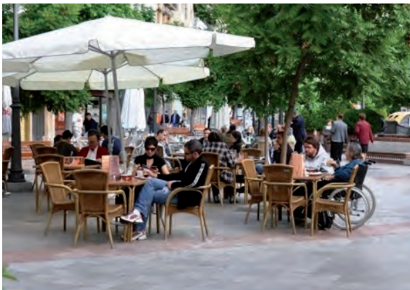
La revitalización de los centros históricos para por su apertura a todos los ciudadanos.

La mayoría de las ciudades andaluzas, de modo general, han sufrido en estos años un crecimiento global de su población y de sus parques de viviendas edificadas en los extrarradios de la ciudad o en nuevos barrios residenciales, que ha ido aparejado con el progresivo envejecimiento y pérdida de población de sus centros históricos . Pero en este abandono del Centro Histórico se conjugan varias cuestiones. Por un lado, el estancamiento derivado de la excesiva protección; por otro la subida de precios por la especulación; y por último la incomodidad que presenta una zona histórica frente a los nuevos modelos de vida establecidos derivada de la no actualización de estas