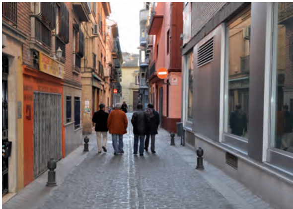
Los centros históricos deben recuperar su carácter de "Ciudad Compacta".

¿Qué ocurre entonces? Que toda esta zona del Centro Histórico se degrada en conjunto, el parque edificado deja de renovarse y de rehabilitarse, el espacio público se degrada y la población que allí vive cada vez tiene más marginalidad. Todas estas cuestiones se producen entre otros factores por la falta de acceso y de accesibilidad, no solo a las viviendas, sino también a los equipamientos y a un espacio público de calidad.