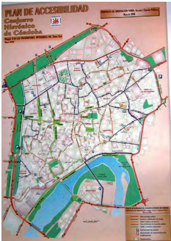
Plan de Accesibilidad del Conjunto Histórico de Córdoba.

explorados en ciudades como Lisboa, donde se producen conexiones mecánicas.