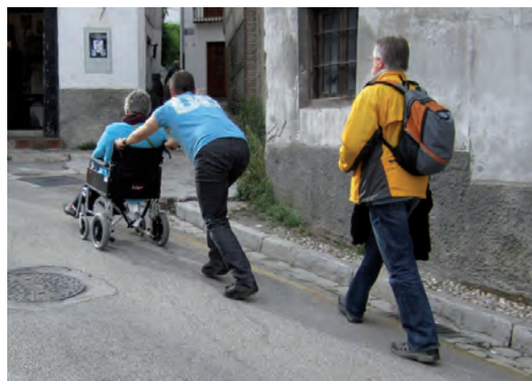
La orografía es un factor importante.

tan fundamentales de la persona como el derecho a la participación, a la cultura, a las actividades recreativas o deportivas, a la relación en libertad, a la información etc.