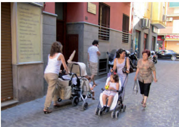
El 40% de la población española resulta beneficiaria de las mejoras de accesibilidad en las ciudades.