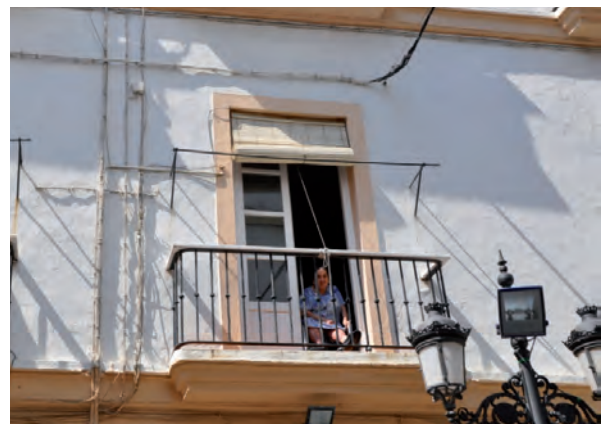
Muchas personas quedan atrapadas en sus viviendas por falta de accesibilidad.

Si hablamos sobre el espacio público entendido en su acepción más general como la superficie de la ciudad por la que nos desplazamos y donde se dan lugares de encuentro que permiten desarrollar la interacción social, y que son además lugares que tienen un mayor atractivo turístico como es el caso de las ciudades de Córdoba, Granada, Sevilla, etc., descubrimos que a menudo, en muchos de estos centros históricos, se trata de un espacio denostado e inhóspito. En este sentido, se debe destacar que las zonas