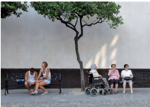
El espacio público debe ser un bien disfrutable por todos los habitantes de una ciudad.