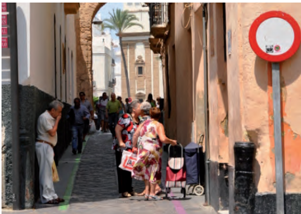
Cuando una ciudad es accesible es más democrática para todos los usuarios.

Es importante hacer hincapié en estos datos ya que a pesar de que pueda parecer que las medidas de mejora de la accesibilidad van dirigidas a una población reducida, afectan a un porcentaje importante de la población de modo directo, ya que para este 40% de la población, estas mejoras les permiten hacer efectivos sus derechos como ciudadanos, y para el 60% restante, les hace una ciudad y una vida más cómoda.