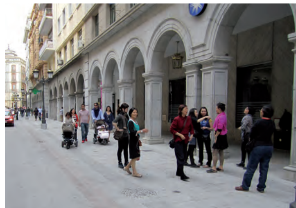
Cuando una ciudad es accesible es más democrática para todos los usuarios.

Charles-Edouard Jeanneret (Le Corbusier).