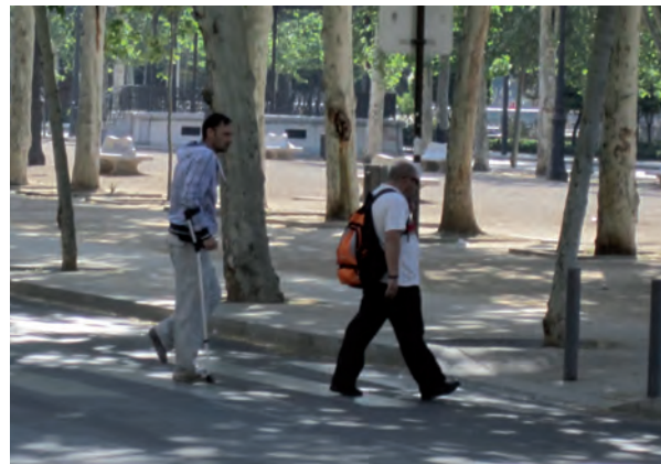
Una ciudad donde se camina y se puede pasear es una ciudad accesible.