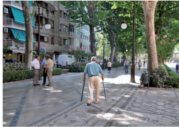
Cuando una ciudad es accesible es más democrática para todos los usuarios.

necesidades de los usuarios del centro de la ciudad, manteniendo su singularidad, su diferenciación y el equilibrio entre la centralidad, la concentración y la accesibilidad.